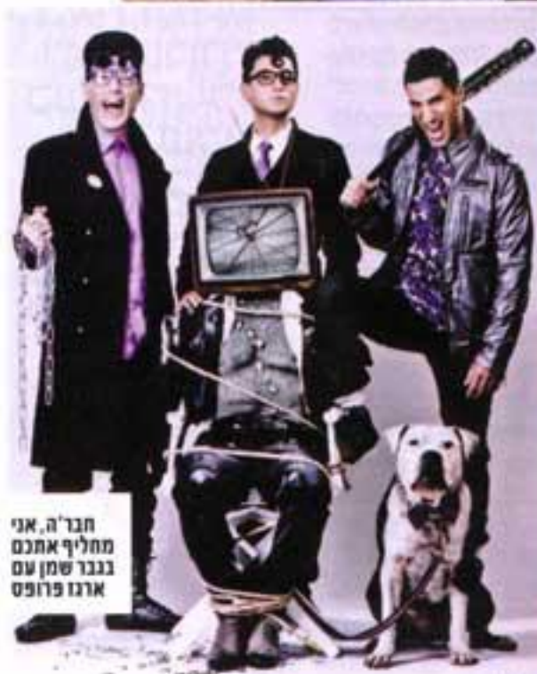
חבר'ה, אני מחליף אתכם ארגו פרופט