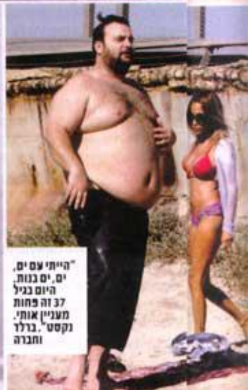
"הייתי עם ים, ים, ים בנות. 37 זה פחות מעניין אותי. ברלד נקסט" וחברה