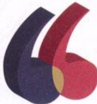
ממשרד של אלן דלון לא התקבלה תזונה

ברלד: "האמת היא שאין בנות שנמשכות לשמנים. הן רוצות אותי בגלל הכריזמה, המעמד, הכסף, זה שאני מצחיק אותן, אבל אם תשאל אותן אם הן נמשכות לבטן? אם הן אוהבות את השומן? אך אחת לא"